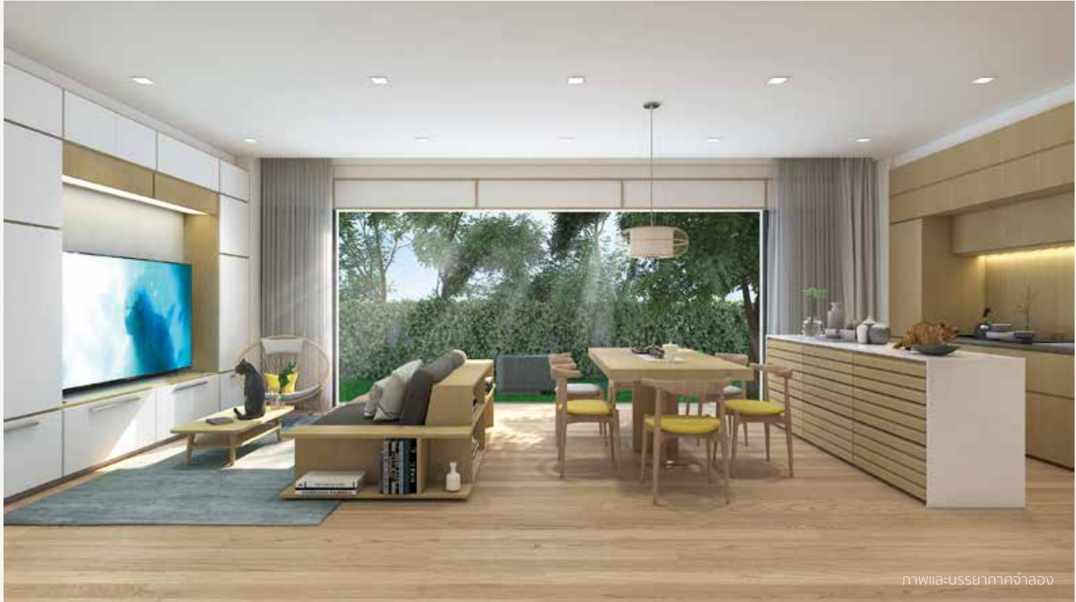
ภาพและบรรยากาศจำลอง

พื้นที่ห้องรับแขกได้ถูกออกแบบกว้างเป็นพิเศษและเชื่อมต่อกับ ส่วนทานอาหาร ส่วนเตรียมอาหาร พร้อมวิวสวนมุมกว้าง ด้วยช่องประตูกระจกบานใหญ่