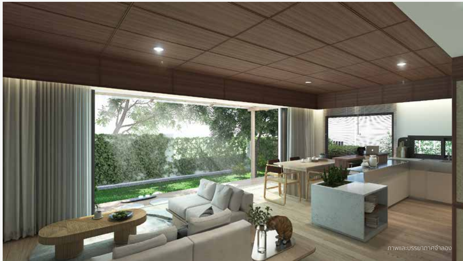
ภาพและบรรยากาศจำลอง

จะอยู่มุมไหนของบ้าน ไม่ว่าจะพื้นที่นั่งเล่น ส่วนทานอาหาร ก็ได้ใกล้ชิดกับสวนหน้าบ้าน