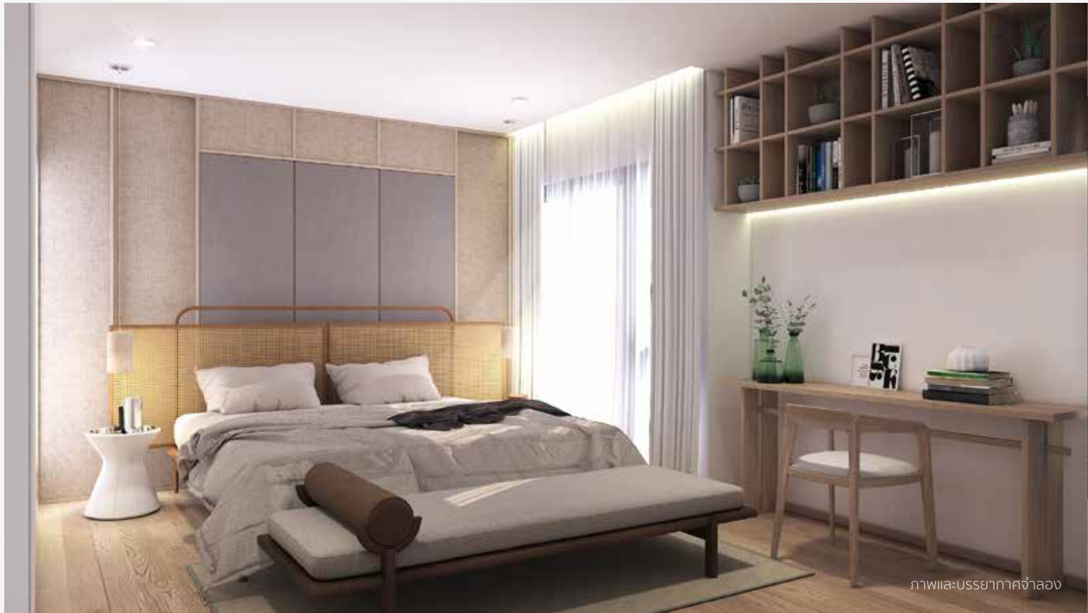
ภาพและบรรยากาศจำลอง