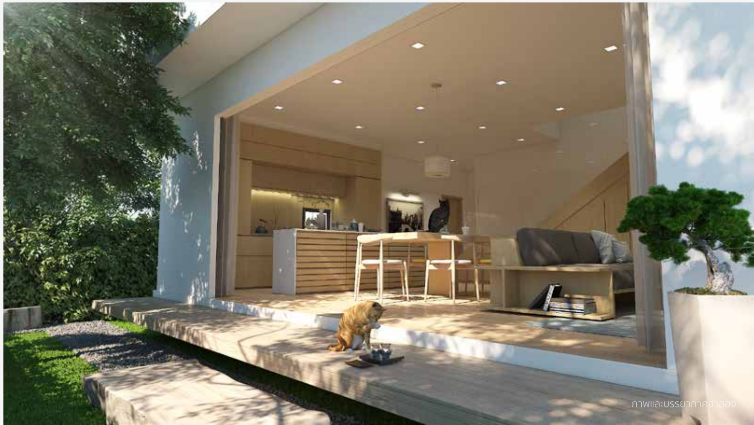
ภาพและUSSยามากาจำลอง